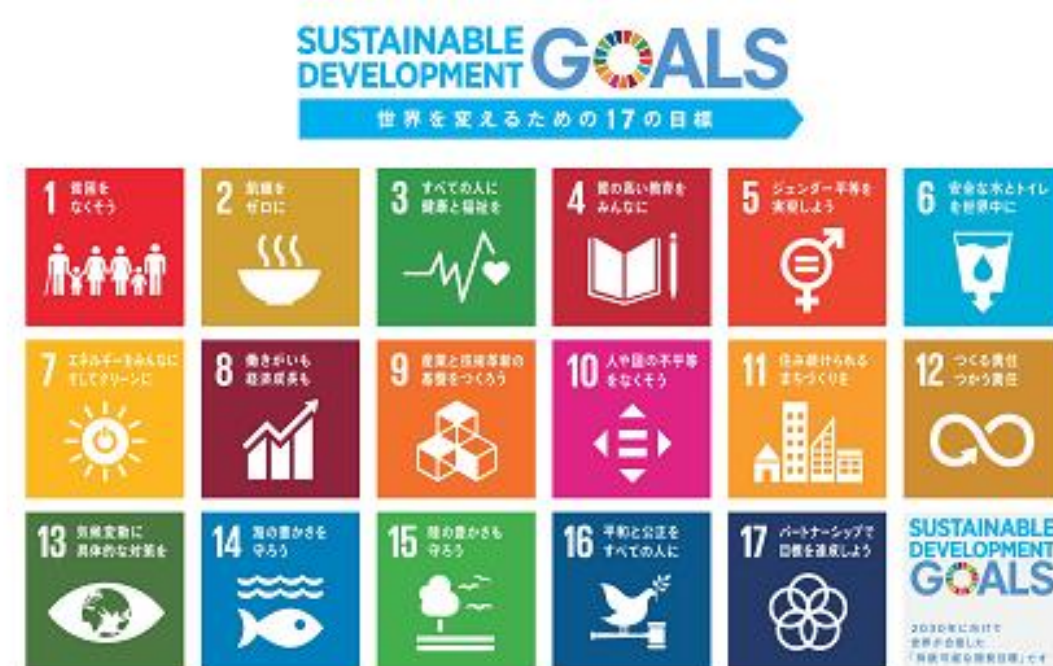
SDG 目標11住み続けられるまちづくり

■ 日 時:平成30年11月7日(水) (受付12:30～)13:00～17:20