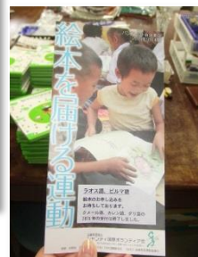
『絵本を届ける運動』 活動に賛同する絵本作家から メッセージも届いていました。