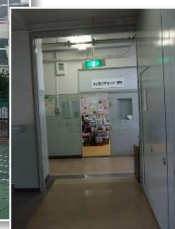
荒川区が廃校舎の教室を無償提供