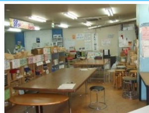
ボランティアが 集う作業場