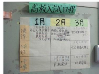
高校入試日程の掲示