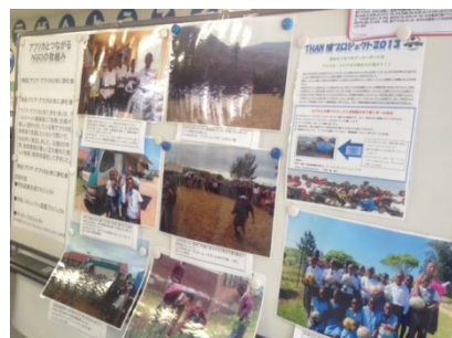
写真：展示会の様子