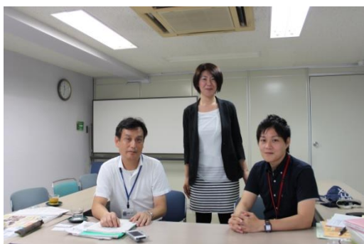
大和市・大和市国際化協会 インタビューの様子