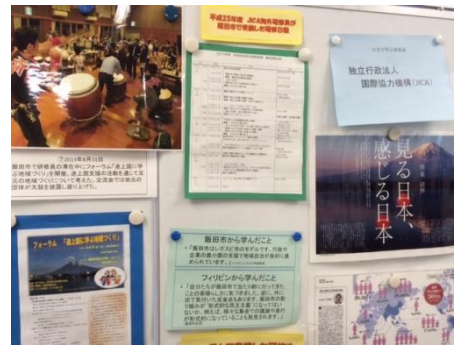
長野県飯田市からフィリピンへ人材を派遣し公民館の取組みについて伝える研修や、フィリピンから長野県飯田市への来訪者を対象に地域の人々が地域のことについて伝える研修の様子について写真展示を中心に紹介した。