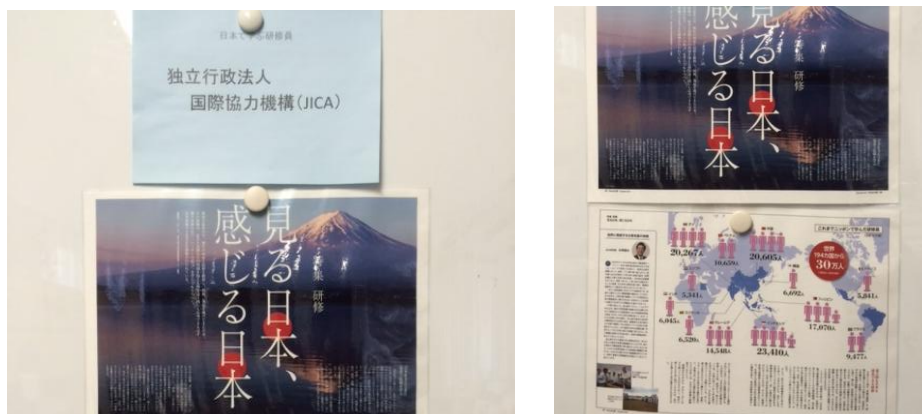
JICA の事業で、海外から来日した研修員の数について図の展示を行い、紹介した。