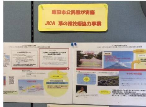
長野県飯田市民館が JICA の草の根技術協力事業を活用して行っている国際協力について、事業実施までの経緯を展示にて紹介した。