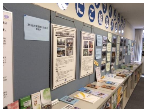
自治体国際化協会が行っている今年度の地域間国際交流プログラムと、LGOTPについて写真や事例集の展示を中心に紹介した。